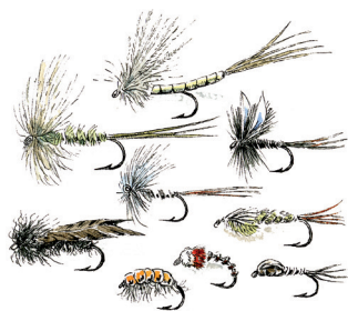
sèches, émergentes, noyées, nymphes...