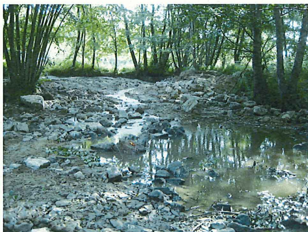
Suppression du seuil du Rivat (Photos libres de droit)